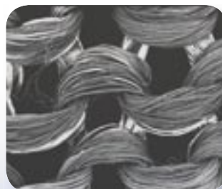
DermaSilk® zoom x76

Indtil nu har man typisk anbefalet bomuldsundertøj til alle med hudlidelser, da bomuld irriterer huden mindre end uld og syntetiske stoffer. Bomuld kan dog også irritere huden. Når DermaSilk og bomuld sammenlignes i et mikroskop, fremgår det tydeligt, at bomuldsfibrene er korte og har et "groft" præg, mens silkefibrene er lange og bløde. DermaSilk sikrer minimal irritation af udsat hud, og er således det mest ideelle undertøj/nattøj inderst mod huden.